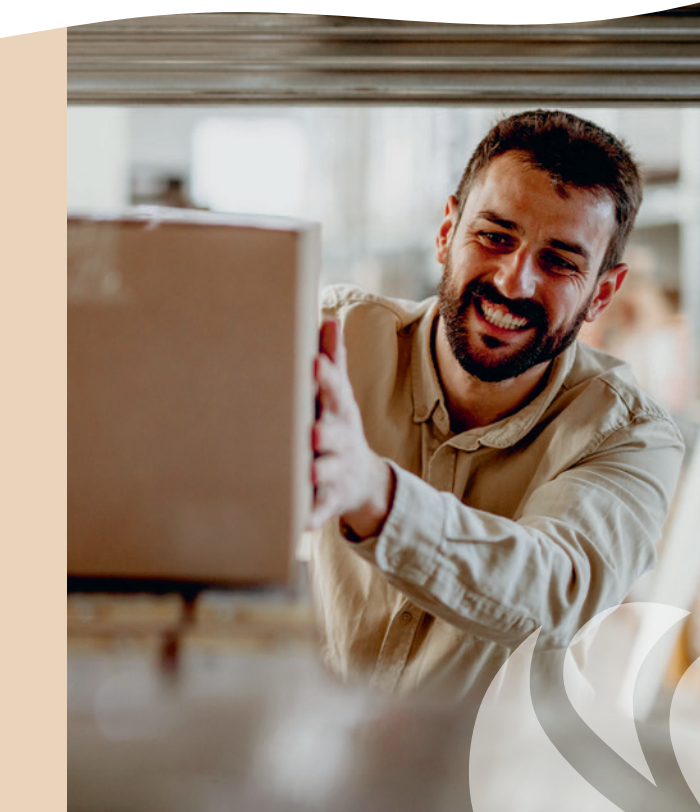
Unsere Dienstleistungen für Firmen und Privatpersonen

Breite Palette an Produkten und Dienstleistungen Unbedingt den Flyer öffnen, um unser Gesamt-Angebot zu entdecken.