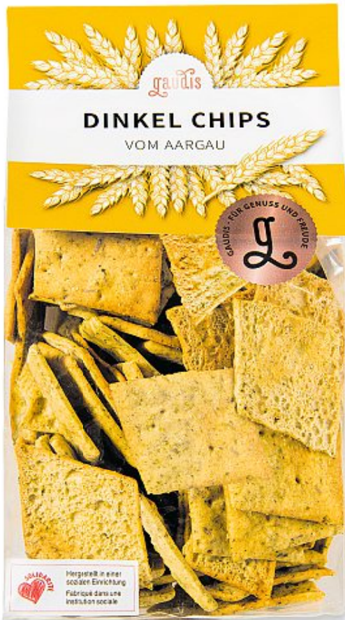
Gaudis Dinkel Chips vom Aargau, 170 g (100 g = 2.92)